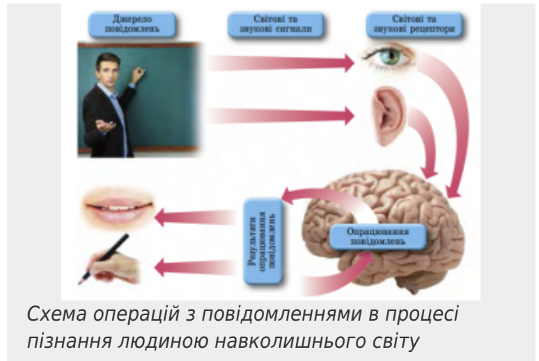
Схема операцій з повідомленнями в процесі пізнання людиною навколишнього світу

Якщо потрібно буде використати набуту інформацію для усної відповіді або запису відповіді в зошит, учениця або учень, після відповідного опрацювання, здійснить передачу повідомлень з використанням, наприклад, органів мовлення.