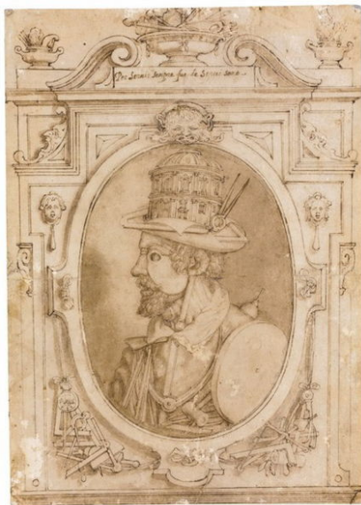
Послідовник Джузеппе Арчімбольдо. “Вигаданий портрет Мікеланджело Буонарроті”, кінець 16 ст.

Графіка — різновид мистецтва, назва якого походить від грецького слова, що в перекладі означає «пишу, дряпаю, малюю». Графіку можна вважати основою всіх образотворчих мистецтв. Адже основним засобом створення художнього образу у графіці виступає найпростіший для людини спосіб відтворення побаченого — лінія, штрих, які творять контур предмету або фігури.