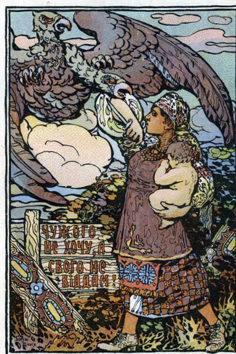
Плакат «Чужого не хочу, а свого — не віддам!» Богуша Шіппіха часів УНР, 1917 рік

Плакат (постер, нім. Plakat, фр. placard — оголошення, афіша, від plaquer — наклеїти, лат. placatum — повідомлення, свідоцтво) — різновид графіки.