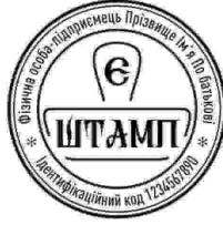
ФОП з лого-27