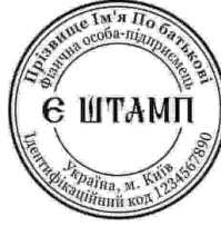
ФОП з ЛОГО-30

Печатку фірми — Печатка — спеціальний інструмент (невеликий гумовий чи металевий предмет), призначений для відбитку зображення, а також отриманий за його допомогою відбиток (відтиск) на папері, воску, пластиліні та інших матеріалах