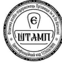
ФОП з лого-29