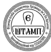
ФОП з лого-28