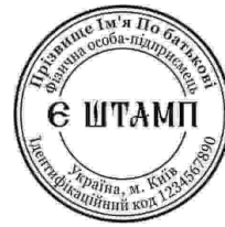
ФОП з ЛОГО-30

Печатку фірми — Печатка — спеціальний інструмент (невеликий гумовий чи металевий предмет), призначений для відбитку зображення, а також отриманий за його допомогою відбиток (відтиск) на папері, воску, пластиліні та інших матеріалах