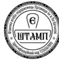
ФОП з лого-29