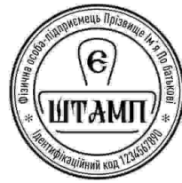
ФОП з лого-27