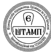
ФОП з лого-28