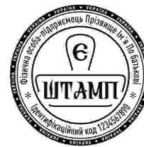
ФОП з лого-29