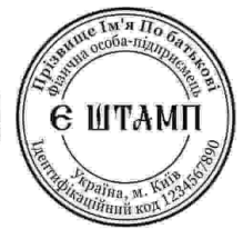
ФОП з ЛОГО-30

Печатку фірми — Печатка — спеціальний інструмент (невеликий гумовий чи металевий предмет), призначений для відбитку зображення, а також отриманий за його допомогою відбиток (відтиск) на папері, воску, пластиліні та інших матеріалах