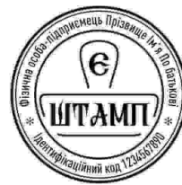
ФОП з лого-27