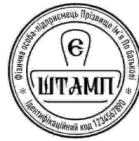
ФОП з лого-27