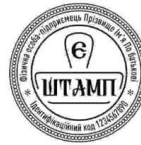
ФОП з лого-28