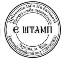
ФОП з ЛОГО-30

Печатку фірми — Печатка — спеціальний інструмент (невеликий гумовий чи металевий предмет), призначений для відбитку зображення, а також отриманий за його допомогою відбиток (відтиск) на папері, воску, пластиліні та інших матеріалах