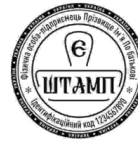
ФОП з лого-29