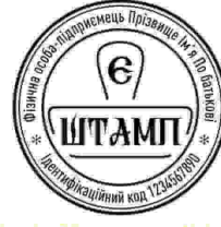
ФОП з лого-27