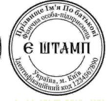
ФОП з ЛОГО-30

Печатку фірми — Печатка — спеціальний інструмент (невеликий гумовий чи металевий предмет), призначений для відбитку зображення, а також отриманий за його допомогою відбиток (відтиск) на папері, воску, пластиліні та інших матеріалах