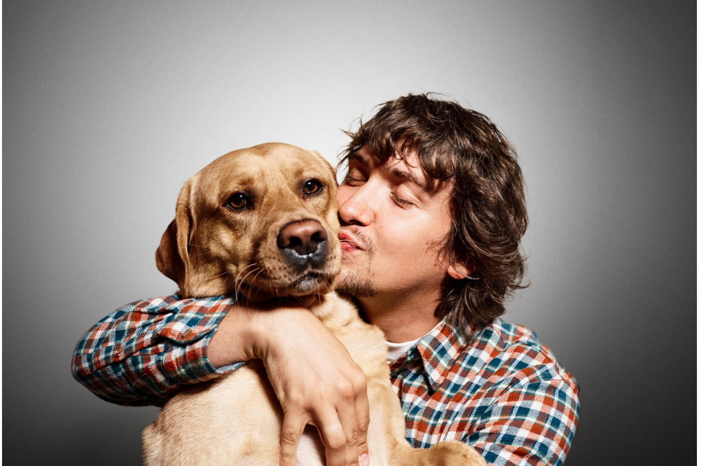
Низьке стиснення (висока якість) JPG - 590 Кб

Примітка. Оригінальне зображення без змін становить 2,06 МБ.